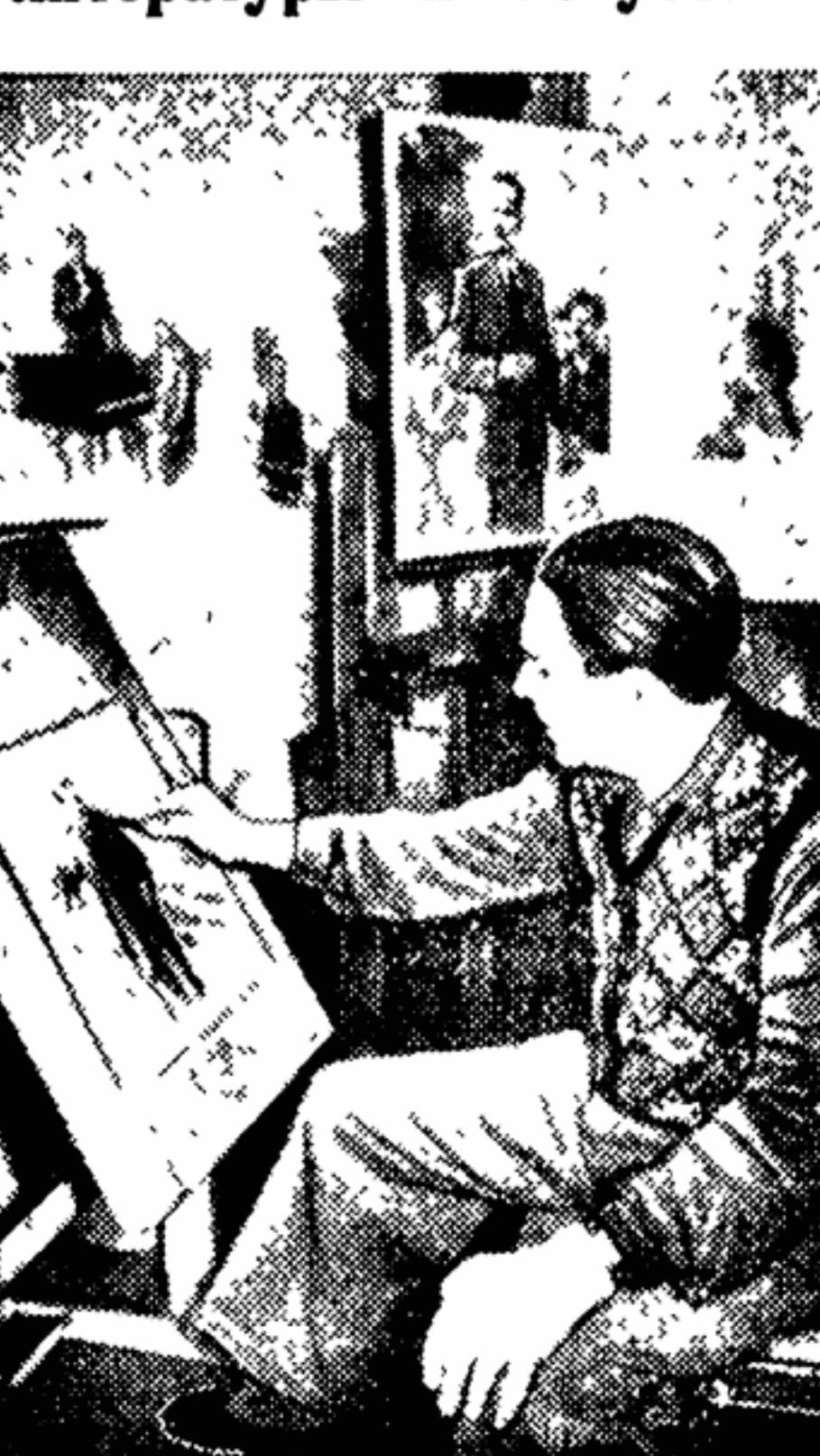
ТАЛЛИН. (Наш корр.). Декада эстонской литературы и искусства, которая состоится в конце этого года в Москве, является ярким событием в культурной жизни Эстонской ССР.

В дни декады в Москве выступят ведущие творческие коллективы республик: Государственный академический театр «Эстония», Таллинский государственный драматический театр имени В. Кингисеппа, Государственный театр «Ванemuйне», Таллинский хореографический училище, ансамбль народного танца республиканской филармонии, эстрадный и симфонический оркестры местного радио и ряд хороших коллективов.