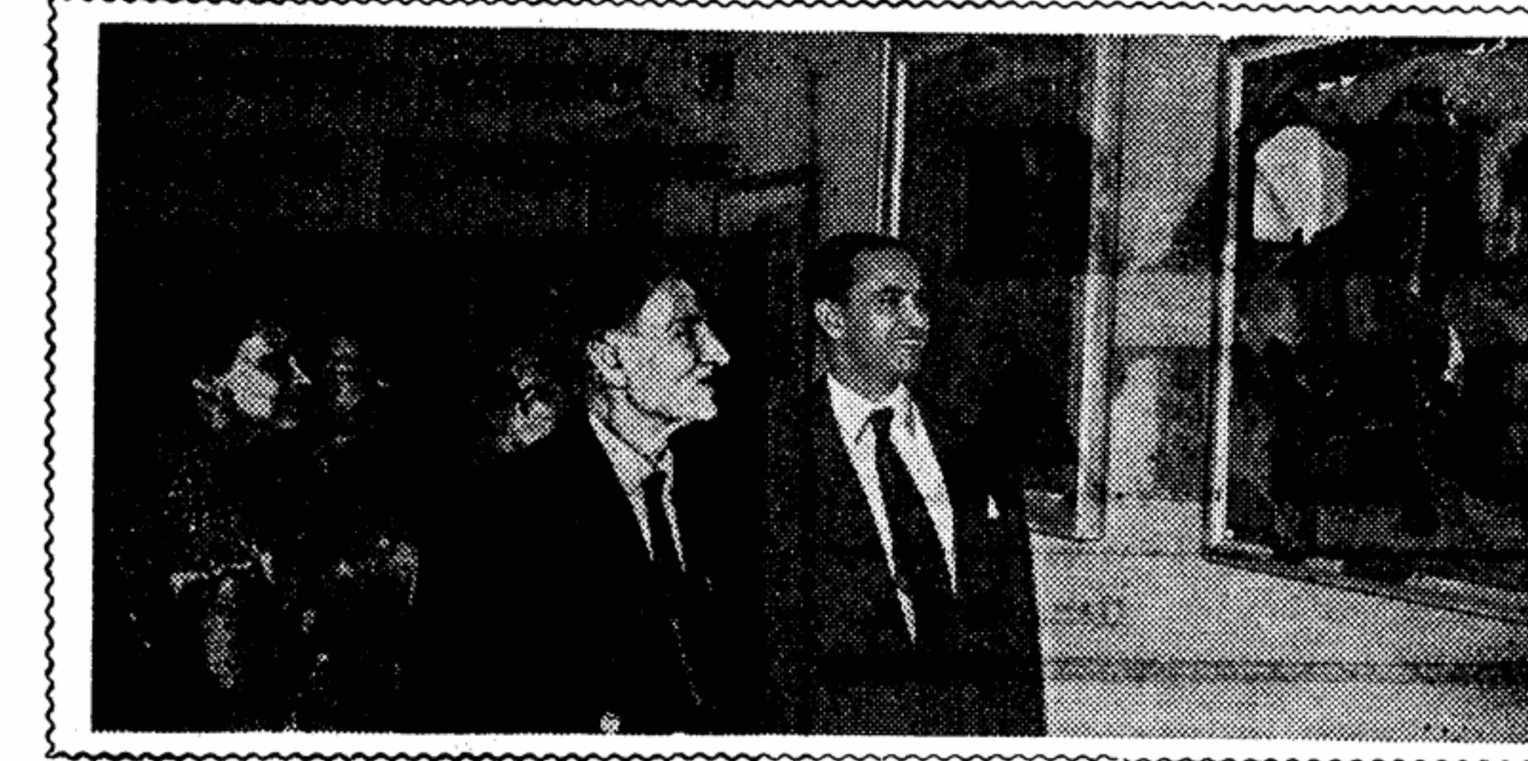
На снимке: индийский художник Б. Саньял (справа) показывает свою работу советскому художнику М. Сарьяну.

Зверев М. На развее. Рассказы. Для младшего возраста. Рисунки Г. Николаевского. Детгиз. 120 стр. Цена 3 руб. 25 коп. Нагибин Ю. Трудное счастье. Повесть. Для среднего и старшего возраста. Иллюстрации И. Калашникова. Детгиз. 175 стр. Цена 4 руб. 95 коп. Сребрянский Г. Лесной прудешка. Рассказы. Для младшего возраста. Рисунки И. Година. Детгиз. 151 стр. Цена 3 руб. 90 коп. Славнов И. Печень дедушка. Рассказы. Для младшего возраста. Рисунки А. Ростовой. Детгиз. 24 стр. Цена 40 коп. Усанова А. На заводе. Стихи. Для младшего возраста. Рисунки И. Харевича. Детгиз. 20 стр. Цена 1 руб. 80 коп. Устиничов Н. Черное озеро. Повести и рассказы. Для среднего и старшего возраста. Иллюстрации В. Федотова. Красноярское книжное издательство. 196 стр. Цена 4 руб. 25 коп. Ширяев А. Одноклассник. Повесть. Сталинградское книжное издательство. 158 стр. Цена 4 руб. 20 коп.